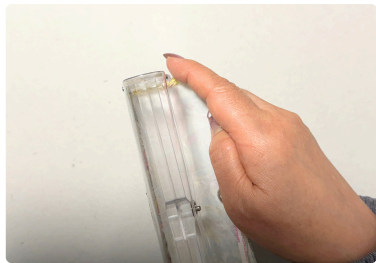
⑪ 蓋内側に貼った 両面テープを剥し、 丸みの有る角は 指の腹部分で 巻きこむように生地を折り貼る。