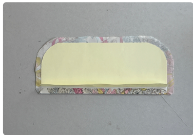
⑦ めくった粘着面に 生地を貼る。