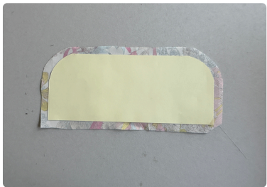
⑤ 周囲に糊代約 6mm 付けて、切り落とす。