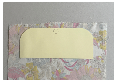
④ 片面の剥離紙を剥して 生地に貼る。