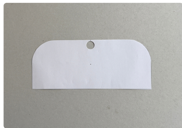
② 線通りにカットして 10mm巾の穴も図面通りに 開けておく。