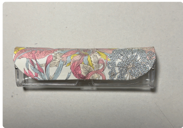
⑫ 背の部分の貼り終わりは ⑧で貼った両面テープで しっかり留める。