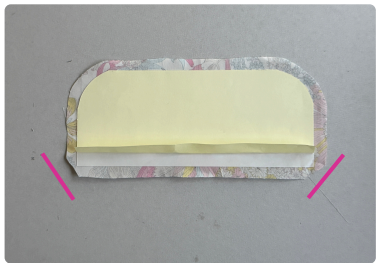
⑥ 剥離紙の下約 1cm程をめぐり 角から約 1mm離れたところを 斜めに切り落としておく。