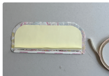
⑧ 貼った生地の上に 5mm巾の 両面テープを貼る。