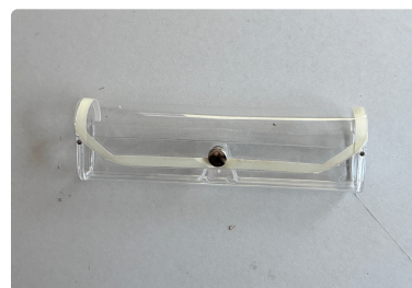
⑨ メガネケース本体蓋部分 の内側に5mm巾の 両面テープを貼っておく。