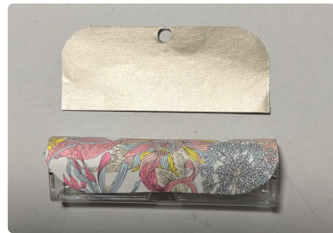
⑬ 型紙を蓋内側に合わせて 一回り（約1mm）小さく リサイズし、その型紙を 合皮シールシートをカットし メガネケースの内側に貼る。