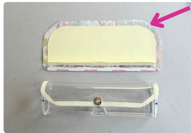
⑩ 両面シールシートの 剥離紙を剥し、 両側のカーブに合わせて 本体蓋部に貼っていく。 ※粘着が強いので、 出来るだけ貼り直しの 無いようにする。